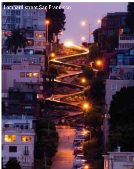
Lombard street San Francisco

I har to hele dage i byen, der er kendt for sine stejle gader, kabelsporvogne og vestens største Chinatown. I bør ikke