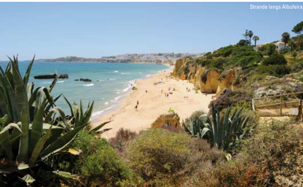
Strande langs Albufeira

Uanset om I er til en ferie hvor afslapning, sol- og havbadning er hovedformålet eller I er ude på en aktiv ferie med sport eller kultur for øje, så har Algarve noget at tilbyde. De færreste forbinder Algarve med et område fyldt med historiske monumenter, men det er ikke desto mindre