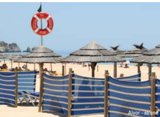
Alvor - strand