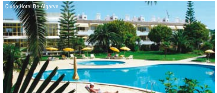
Clube Hotel Do Algarve

eller terrasse med udsigt over haven og swimmingpoolen. Lejligheder af typen T1 har desuden et soveværelse. På stedet er der desuden indendørs- og udendørs swimmingpool, sauna, tennisbane, restaurant og bar. Perfekt til børnefamilier.