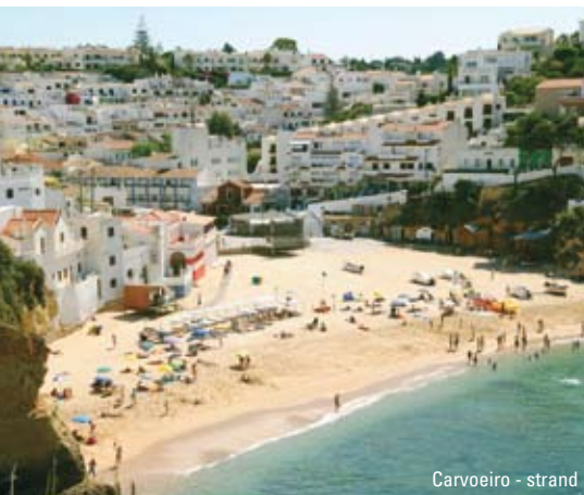
Carvoeiro - strand

150 kilometer sydvendt Atlanterhavskyst vekslede mellem klippefyldte strækninger afbrudt af små bugter med kridhvide strande og kilometervis af uafbrudt sandstrand. Det er Algarve i en nøddeskal - et sammensat område, der rummer alt fra det dramatiske og imponerende til det blide og romantiske.