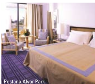
Pestana Alvor Park

Hotellet tilbyder 55 luksuriøse og velmøblerede lejligheder – alle indrettet med fuldt udstyret køkken med bl.a. komfur med ovn, opvaskemaskine, mikrobølgeovn, opholdsstue med aircondition, TV, radio, telefon og safetybox, samt en dejlig balkon med havudsigt. Lejligheder af typen T1 har desuden 1 soveværelse. Det er muligt at lejé lejlighed af hver type lejligheder med dør imellem, så man har én stor lejlighed til 5 personer. Pestana Alvor Park byder også sine gæster på mange dejlige faciliteter såsom et stort, dejligt udendørs swimmingpoolområde, indendørs swimmingpool, sauna, jacuzzi og tyrkisk bad samt restaurant og bar.