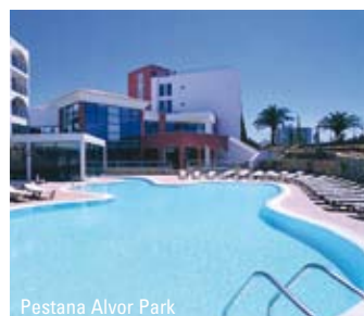
Pestana Alvor Park