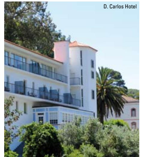
D. Carlos Hotel

"blot" ønsker at koble af og blive forkælet. Det er samtidig en unik mulighed for at opleve en helt anderledes side af Algarve og dermed få en ferieoplevelse, som man ellers ikke forbinder med en ferie på Algarvekysten.