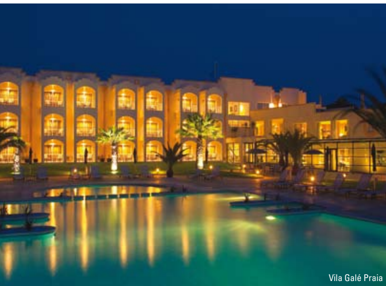
Vila Galé Praia