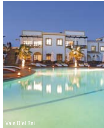
Vale D'el Rei