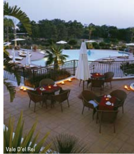
Vale D'el Rei