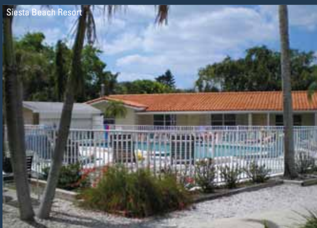
Siesta Beach Resort