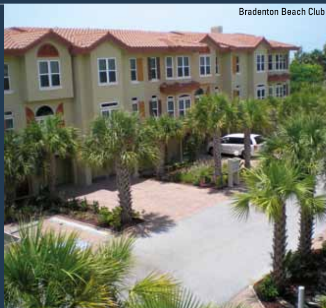
Bradenton Beach Club

Bradenton Beach Club er et udsøgt luksus kompleks beliggende ved Bradenton Beach i den sydlige del af smukke Anna Maria Island. Her findes en mindre swimmingpool og lækre Bradenton Beach finder I på den anden side af vejen, hvortil kompleksets gæster har privat adgang. Lejlighederne er godt indrettet med stort køkken alrum med sofa arrangement og spiseplads, stor terrasse og to soveværelser. Ikke langt fra komplekset findes restauranter, gode butikker og den gratis bus der kører rundt på øen har stop ikke langt herfra. Gratis parkering.