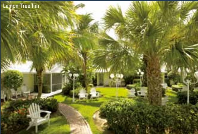
Lemon Tree Inn

Naples har ry for at være Floridas mest sofistikerede by, hvor de rige og kendte flokkes, men der er også plads til det stadigt stigende antal turister, der finder vej til denne lille perle. Her skal I nyde shopping mulighederne, caféerne og restauranterne og bare slentre rundt. Belliggende i det sydvestlige hjørne af Florida, er strandene måske knap så flotte, som de er lidt længere mod nord, men Naples er bla. et fantastisk udgangspunkt for turen til det eventyrlige naturreservat, The Everglades. Blot en times kørsel og I er midt i alle herlighederne! På en tur med airboat kommer I helt tæt på alligatorer, skildpadder og et utal af fugle.