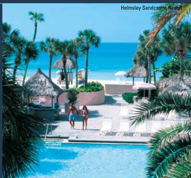
Helmsley Sandcastle Resort

Dette indbydende Helmsley-hotel er beliggende på Lido Beach med egen 1,8 km lang hvid sandstrand og er kendetegnet ved en dejlig afslappet atmosfære. Alle 179 pænt møblerede værelser har aircondition, telefon, TV, hårtørrer, strygebræt/-jern, safetybox, køleskab samt kaffemaskine. Værelserne med udsigt over Den Mexicanske Golf er større end de andre og har balkon eller terrasse. Værelserne med udsigt over poolområdet har sammen størrelse, som dem med havudsigt, men ingen balkon. Indtag morgenmaden i Sandcastle Coffee Shop, snup en let frokost i Sandcastle Pool Bar og nyd en middag med eft.erfølgende drink i Candlelight Restaurant and Lounge. Slap af ved hotellets swimmingpool eller på stranden, hvis I da ikke lige skal være aktive i fitness- eller vandsportscentret. Gratis parkering.