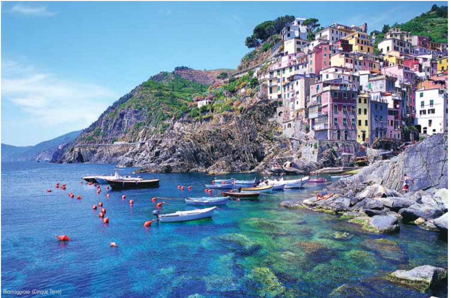
Riomaggiore (Cinque Terre)

3 nætter La Spezia (Cinque Terre) • 3 nætter Montecatini Terme • 1 nat Parma