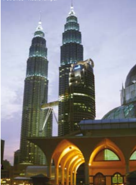
Petronas - Kuala Lumpur

Overnatning: Mutiara Taman Negara Resort i chalet-værelse. (M/A)