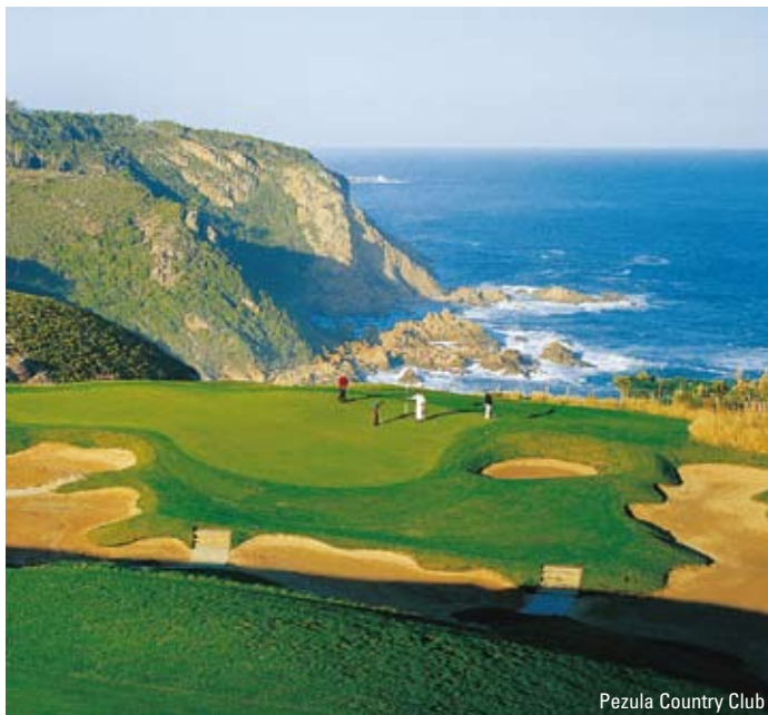
Pezula Country Club