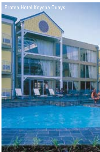
Protea Hotel Knysna Quays

Ved ankomsten til George lufthavn modtages I af en repræsentant fra vores lokale samarbejdspartner, der hjælper jer med at få udleveret den lejede bil. Om eftermiddagen er det tid til et spil golf på enten George Golf Course (hvis I bor på Protea Hotel King George) eller på Fancourt Links Golf Course (hvis I bor på Fancourt Hotel & Country Club)