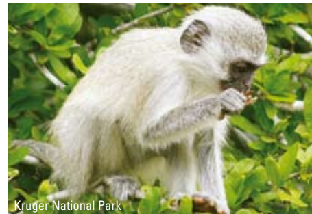
Kruger National Park

Efter en sidste tidlig safaritur bliver I kørt til Hoedspruit lufthavn, hvorfra I flyver til Cape Town. Her bliver I mødt