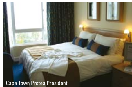
Cape Town Protea President

af den engelsktalende guide, der sørger for transport til jeres hotel.