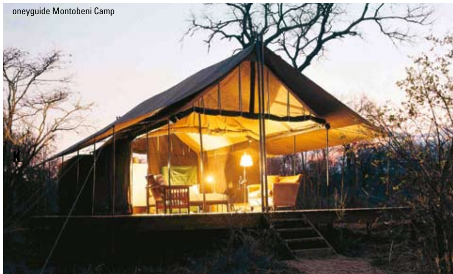
oneyguide Montobeni Camp

Overnatning (3 nætter): Protea Hotel President (havudsigt) eller Waterkant House (Luxury kategori)