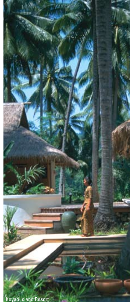
Koyao Island Resort

TUR 106: 3 nætter Bangkok • nattoget til Chiang Mai • 3 nætter Chiang Mai • 6 nætter Koh Yao