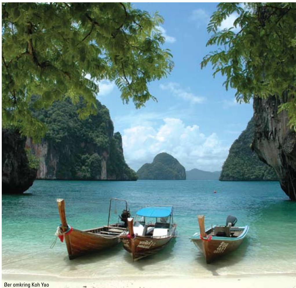
Øer omkring Koh Yao