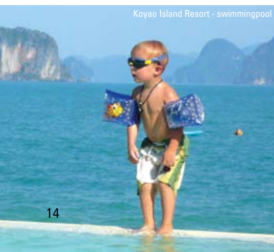
Koyao Island Resort - swimmingpool