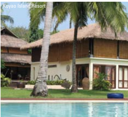
Koyao Island Resort