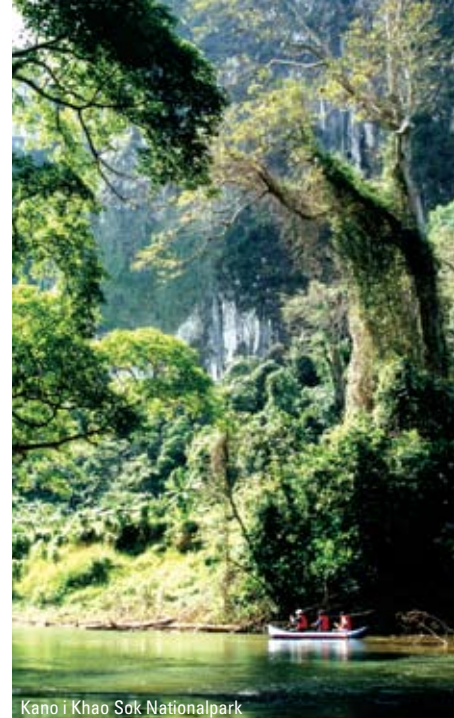
Kano i Khao Sok Nationalpark