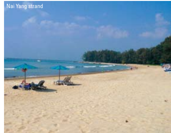
Nai Yang strand

Ferien er ved at være forbi. Hen på eftermiddagen bliver I hentet på Adamas Resort og kørt til lufthavnen, hvor Thai Airways vil flyve jer til Bangkok lufthavn. Herfra kan for sættes til Danmark.