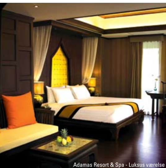
Adamas Resort & Spa - Luksus værelse

“Kata centrum – et godt og roligt sted med et udvalg af restauranter og forretninger.”