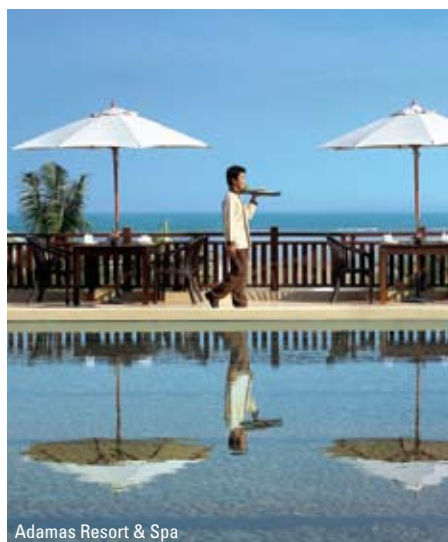
Adamas Resort & Spa