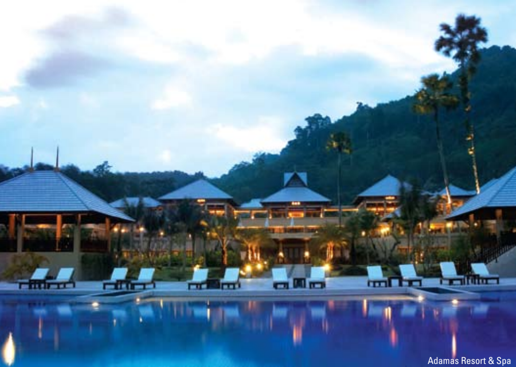
Adamas Resort & Spa