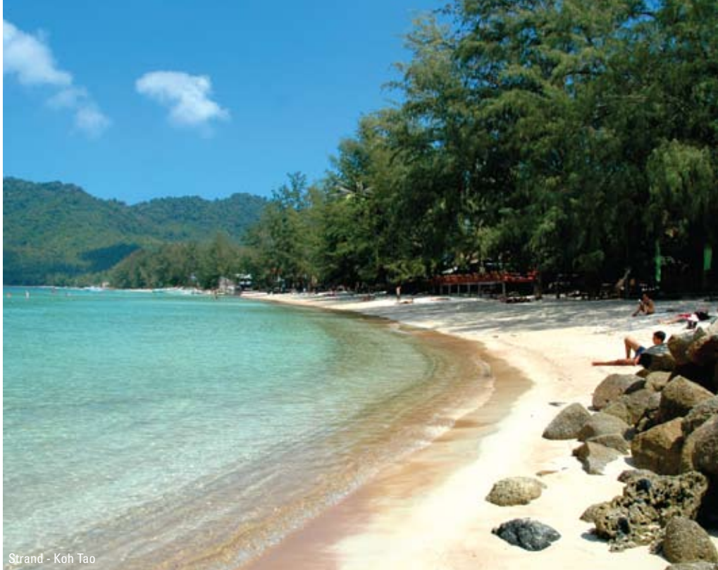
Strand - Koh Tao

Koh Phangan bliver ofte sammenlignet med Koh Samui, som denne tog sig ud for 12-14 år siden, før de små skæve bungalows blev afløst af moderne hoteller, før lufthavnen blev anlagt, og før den driftige shopping-gade i Chaweng opstod. Koh Phangan har fortrinsvis været forbeholdt rygsækturisterne, der har boltret sig på øens fremragende strande, trekket i bjergene og junglen og badet i de smukke vandfald. Selvom antallet af turister har været stigende de seneste år, og flere nye bungalows er skudt op, så er Koh Phangan fortsat den mindst turistede af de 3 øer I besøger. Her er ingen stress og jag, vandet er klart strandene hvide