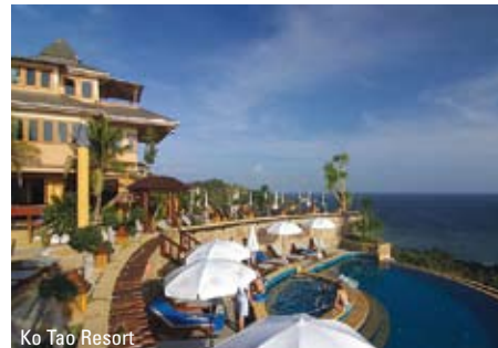
Ko Tao Resort

omgivelser samt en dejlig sandstrand. Hjertet i resortet er den lækre swimmingpool, som ligger lige ned til stranden, hvorfor I her er i første parket til at nyde de smukke solnedgange over havet.