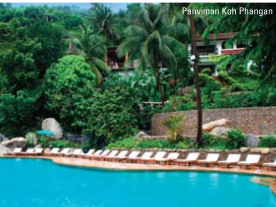
Panviman Koh Phangan

Efter morgenmaden er det tid til at forlade Panviman Resort og køre retur til Thong Sala Pier, hvor I kom ind med båden.