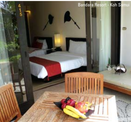
Bandara Resort - Koh Samui

Hurtigfærgerne afgår kl. 11:00 og I skal være på havnen 30 minutter før afgang. De 20 km til Koh Samui tilbagelægges på 45 minutter. Ved ankomsten til Koh Samui tager I en taxi (for egen regning) til Bandara Resort som er beliggende på den nordlige Mae Nam strand. Overnatning: Bandara Resort. (M)